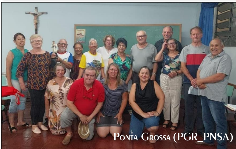
PONTA GROSSA (PGR_PNSA)