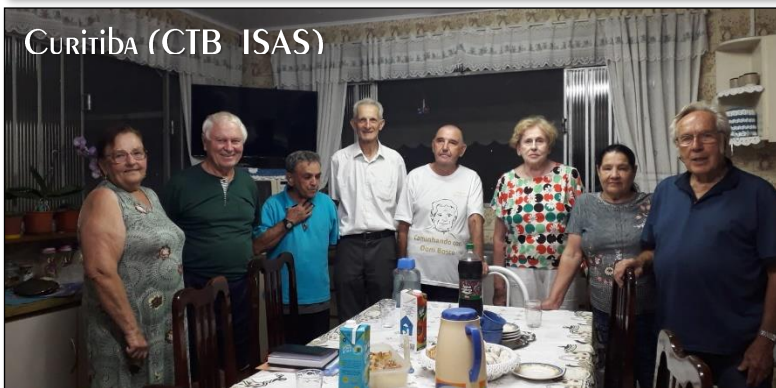
Curitiba (CTB ISAS)