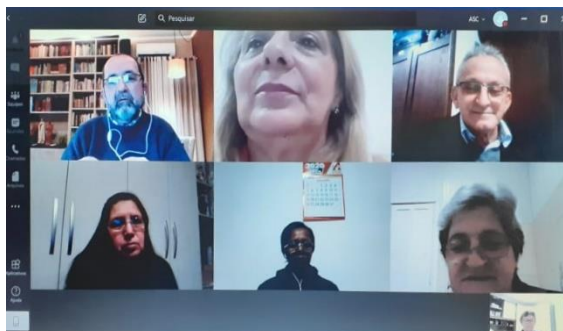
REUNIÃO DA SECRETARIA EXECUTIVA BPA Julho