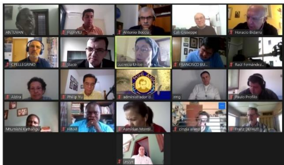
REUNIÃO DO CONSELHO MUNDIAL Junho