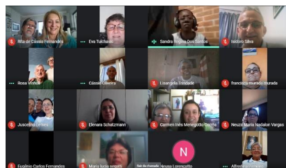
MOMENTO DE FORMAÇÃO PROVINCIAL O Projeto de Vida do Salesiano Cooperador Agosto

"O Salesiano Cooperador é o primeiro e principal responsável pela sua formação".