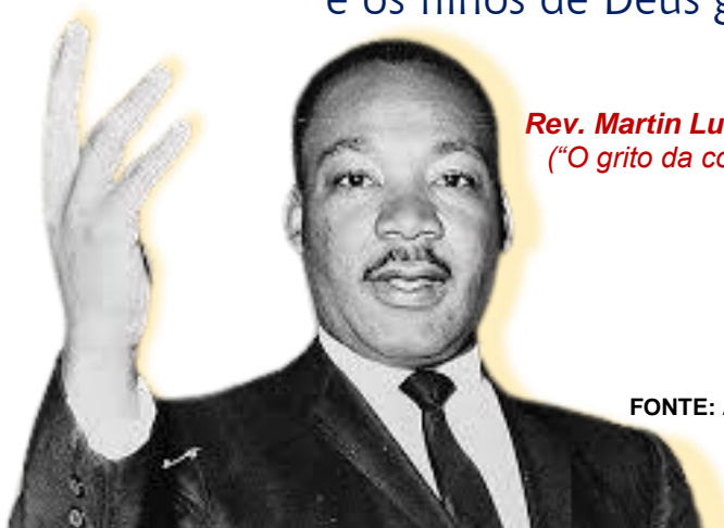
Rev. Martin Luther King Jr. ("O grito da consciência")

As estrelas da manhã cantarão em coro, e os filhos de Deus gritarão de alegria.